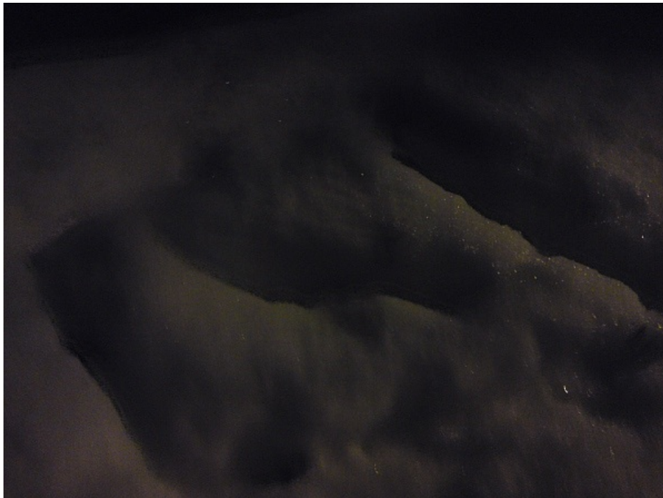
Píča za dne