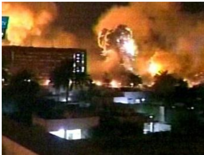
Screenshot z třetího levelu nové hry Doom 3

23:09 - Na Vysočině řádí neznámej škůdce, kterej ohlodává stromy a servává z nich kůru.