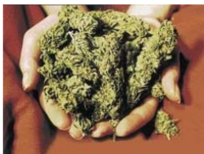
Přivítal mě s otevřenou náručí.

Kdyby byly anarchisti co k čemu, taxe vrátěj ke svejm ideálům a bastlej po skvótech bomby (takový ty kulatý, černý, s doutknákem), který by pak jako správný anarchisti vrhali po nepřátelích společnosti. Ja osobně bych vrhnul na jednoho pána z KDU-ČSL nebo wodkad' že je.