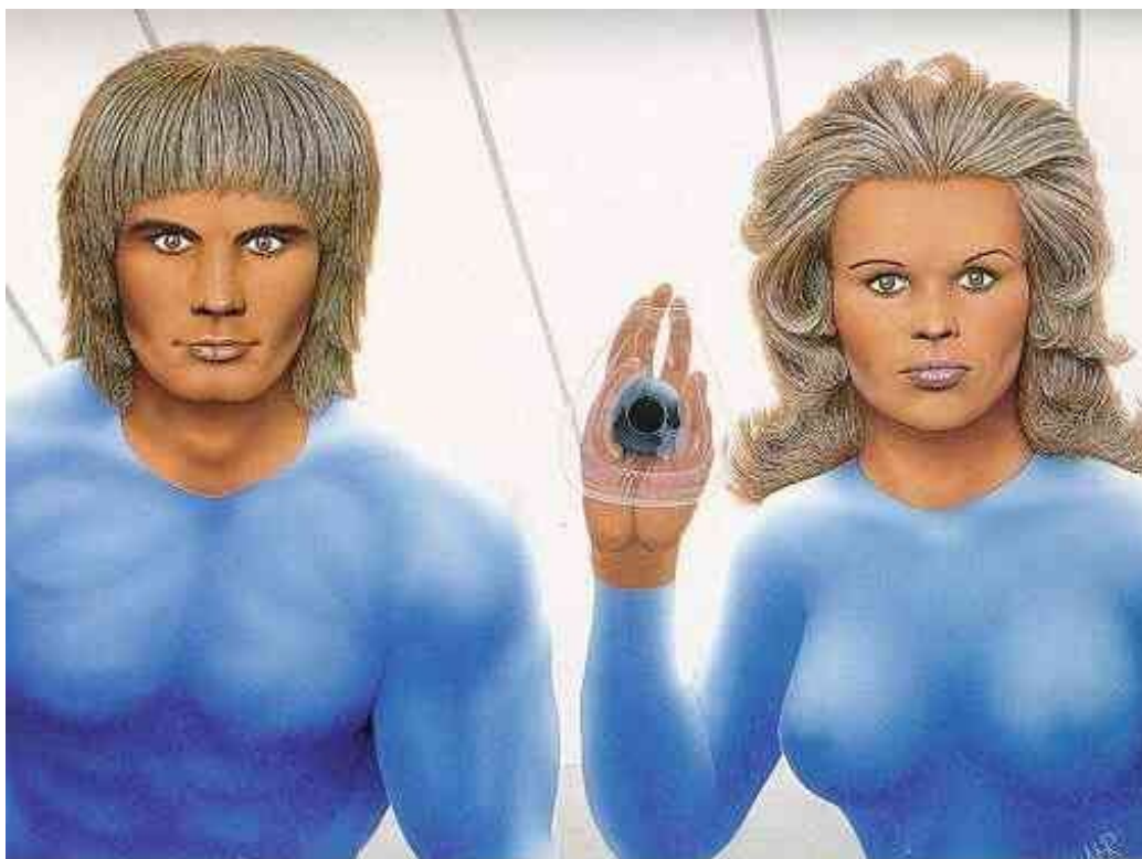
Vesmírní lidé — muž a žena — ve vesmírné lodi. Osvětlení je typické uvnitř vesmírné lodi — ze souvisle zářících stěn. Malba.

Takže, za prvý je to hnusný jaxvině. Vyzařuje z toho taková negativní energie. Za druhý nevím co to drží ta žena v ruce. Jediný co by to mohlo bejt je antikoncepce, lidově nazývaná pesarem. Fuckt newim. A hlavně, čím dýl se na to koukám, tím mýn nechápu proč sou modrý.